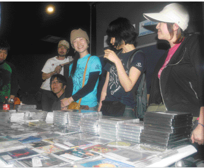
EL festival funciona para promover los cds de los grupos participantes.