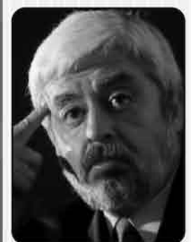
LOS GRANDES MISTERIOS DEL 3ER PLANETA Domingo 18:00 hrs. Canal 3

**Programación sujeta a cambios de última hora información proporcionada por la televisora y el teleguía**