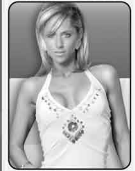
Deportips Domingo 10:30 hrs. Canal 20.