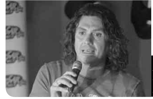
Saúl Hernández fue vocalista del grupo Caifanes.